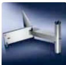
23.0240.00 SCREEN-AGE Eck-Halterung AUSSEN spannbar

B: 340 mm H: 420 mm L: 300 mm 📦 2640 g VPE: 1