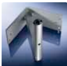
23.0241.00 SCREEN-AGE Eck-Halterung INNEN spannbar

W: 13,39 inch H: 16,54 inch L: 11,81 inch 📦 2640 g PU: 1