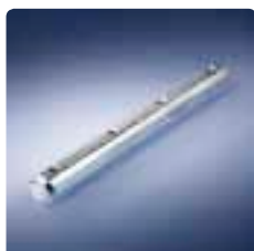
36.1215.01 Schienenverbinder Stahl verzinkt L=150 mm Inkl. 6-Kant-Schlüssel passend für den SIGN-WARE®-Kederkanal

Ø: 1,97 inch L: 236,22 inch 📦 9810 g PU: 1